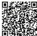
AHMAD SHARIFF BIN HAMBALI KETUA EKSEKUTIF CHIEF EXECUTIVE PIHAK BERKUASA PERANTI PERUBATAN MEDICAL DEVICE AUTHORITY

Pendaftaran ini diberikan tertakluk kepada peruntukan-peruntukan di bawah Akta 737 dan peraturan-peraturan yang dibuat dibawahnya serta syarat-syarat seperti di Lampiran 2. This registration is granted subject to the provisions under Act 737 and its subsidiary legislations and the conditions as in Attachment 2.